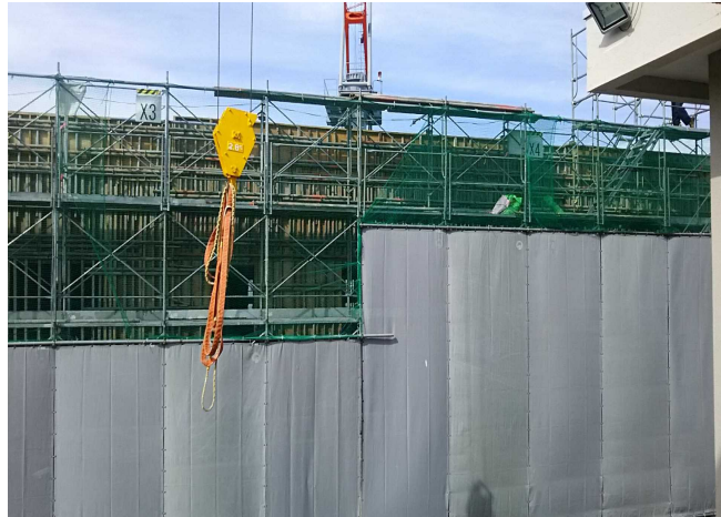
②教室・特別・管理棟建設地