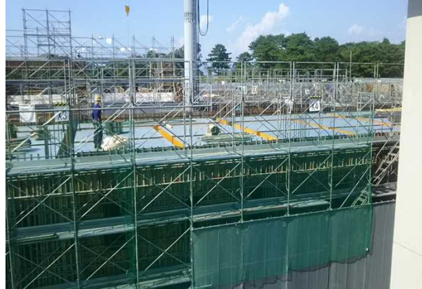
②教室・特別・管理棟建設地