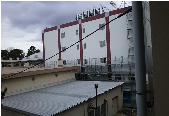
②教室・特別・管理棟建設地