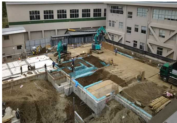
②教室・特別・管理棟建設地