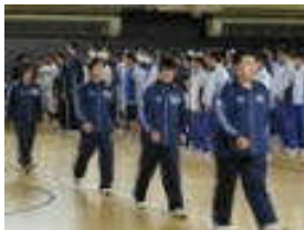
ウェイトリフティング部