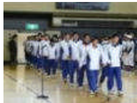
陸上競技・駅伝部