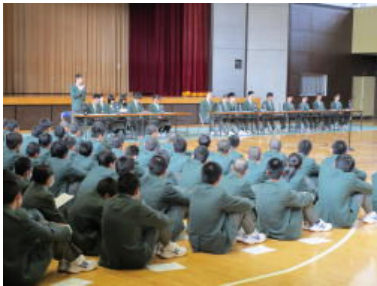
生徒会長からの挨拶

4月26日(木)に本校大体育館にて、生徒会定期総会が開催されました。全校生徒が筆記用具と議案書を持参し体育館に整列、生徒総会成立の報告を行った後、開会の言葉で始まりました。生徒会長挨拶、議長団挨拶の後、生徒会活動の報告や部活動についての報告、今年度の生徒会活動の計画等について話し合いが行われました。また、各クラスの代表から、要望や質問が出されるなど意見交換が活発に行われました。定期総会後には、生徒指導部より連休中の行動について諸注意がありました。