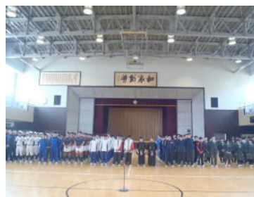
部活動激励会の様子