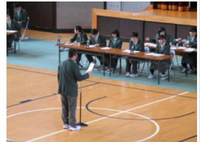
クラス代表が意見や要望を！