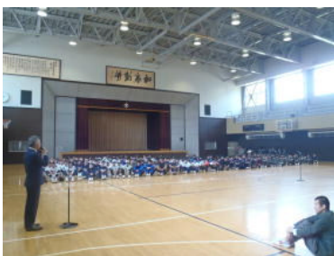
校長先生から激励の言葉

4月27日(金)の6校時より、部活動激励会と、県北総体・野球春季県北大会の壮行会が本校大体育館で行われました。各部代表の挨拶では、今年度の目標や大会に臨む決意を述べてました。校長先生、生徒会長からも激励の言葉をいただき、最後に全校生徒で校歌を斉唱して健闘を誓い合いました。