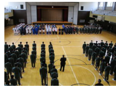
全校生徒で校歌を斉唱